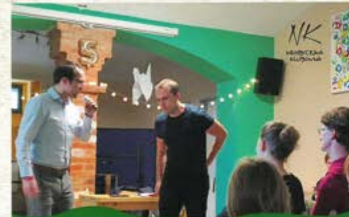
JIŽ PĚT LET MODERUJEME PROSTOR PRO NEOBYČEJNÉ AKCE PF 2023