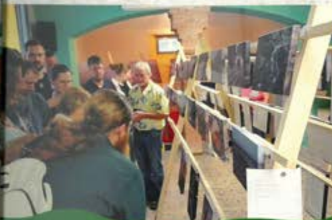
FOTOGRAFIE VOJTĚCHA SUCHÉHO VERNISÁŽ VÝSTAVY