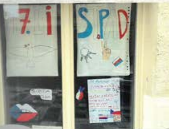
VÝZDOBA K VÝROČÍ 17. LISTOPADU